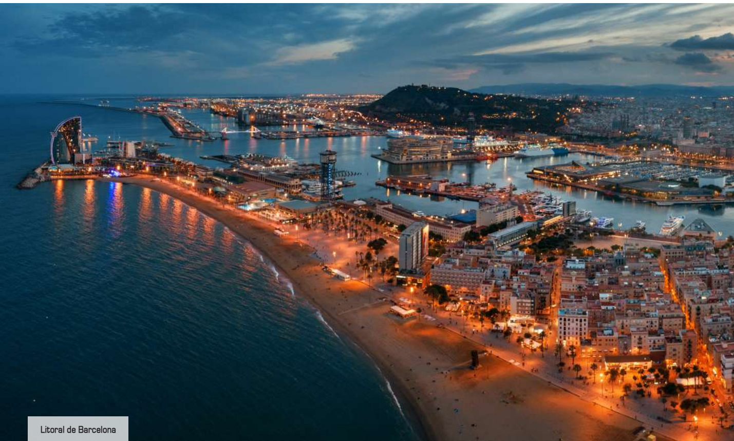
Litoral de Barcelona

Es una de más de las novedades que se esperan en la Ciudad Condal, una urbe en la que parece no reducirse el espacio para la innovación. Incluso iconos del destino como el Nou Camp, estadio del F.C. Barcelona, se están reinventando.