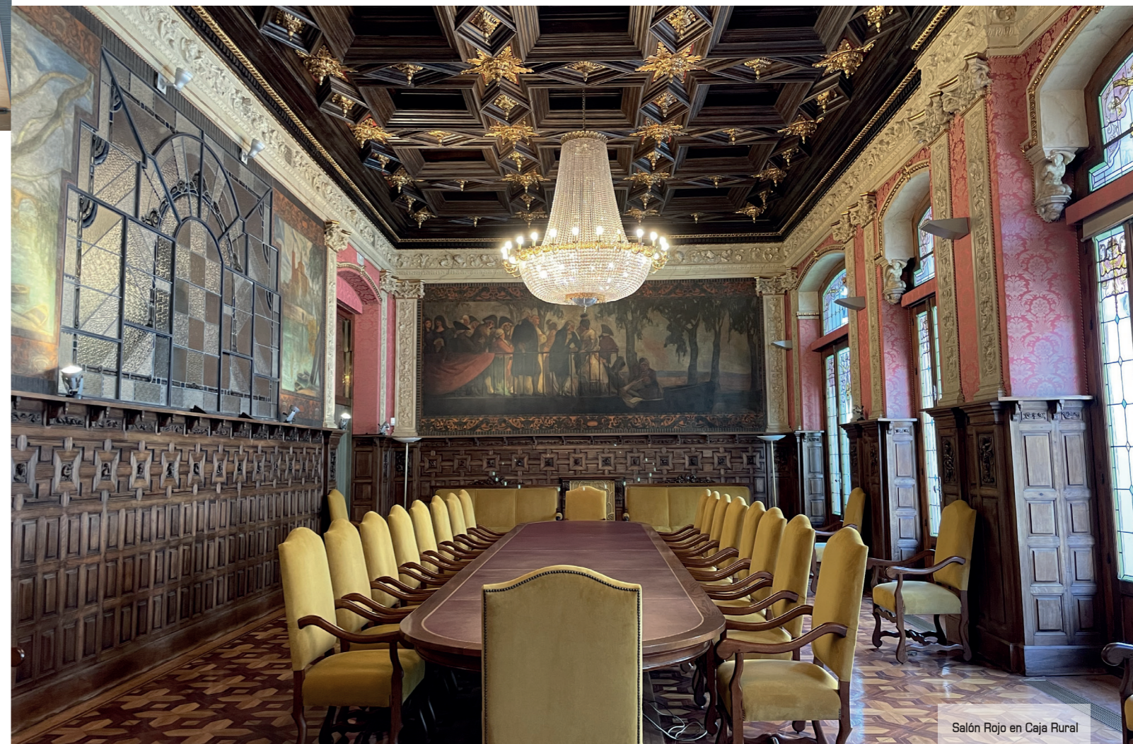
Salón Rojo en Caja Rural

Su interior fue testigo de importantes momentos históricos de trascendencia internacional como la redacción de las Capitulaciones de Santa Fe (el acuerdo entre Cristóbal Colón y los Reyes Católicos previo al descubrimiento de América), y por sus salas pasaron desde grandes literatos españoles al científico Albert Einstein, quien celebró aquí su cumpleaños. Su valor histórico se celebra en visitas guiadas teatraliza-