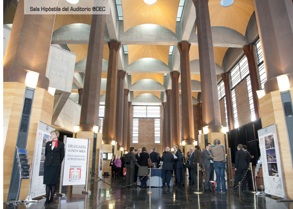
Sala Hipóstila del Auditorio

En su jardín se puede programar un cóctel para 500 invitados, mientras que Supernova Club , la mayor discoteca de Zaragoza, puede acoger desde una presentación de vehícu-