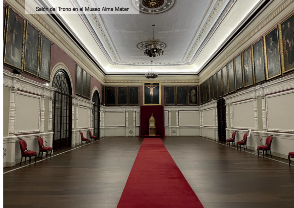
Salón del Trono en el Museo Alma Mater

La llamada Expo del Agua ocupó el área del meandro de Rarillas, en la ribera norte. Aunque la crisis económica retrasó el aprovechamiento de las instalaciones tras el evento, y aún hoy día algunos pabellones no tienen un uso definido, su legado es patente. Hoy es un espacio revitalizado donde se