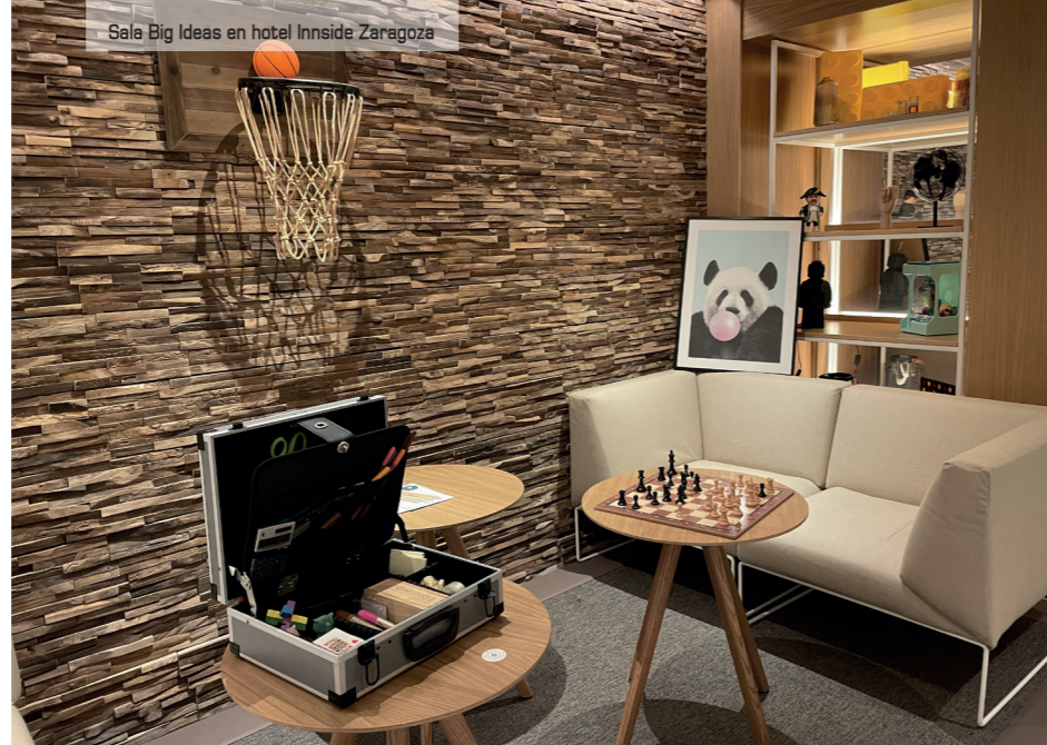
Sala Big Ideas en hotel Innside Zaragoza

Zaragoza es equidistante de Madrid y Barcelona, del norte de España y de la costa levantina. El viaje desde Latinoamérica debe realizarse vía Madrid o Barcelona, ciudades con las que la conexión no es por