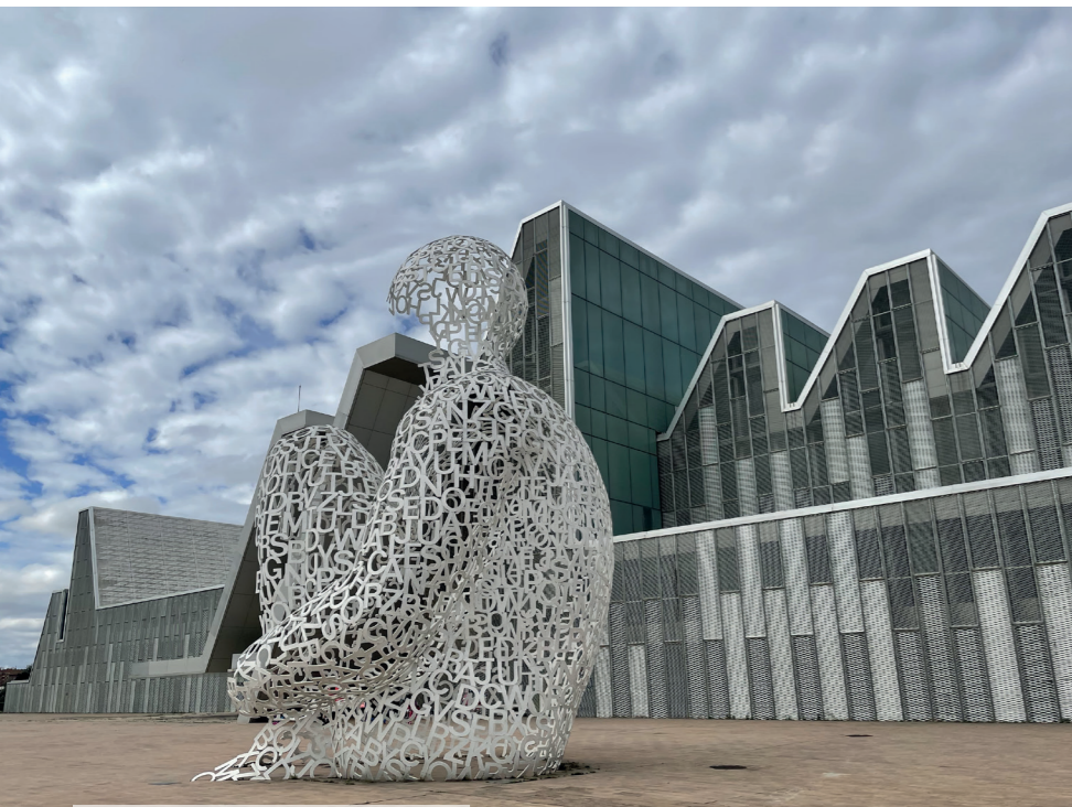
Alma del Ebro ante el Palacio de Congresos

La empresa Ebronautas organiza descensos en balsa neumática por el río Ebro, donde los miembros del equipo han de coordinarse bien para remar, ya sea en piragua, o en masivas "piraguadas" en las que hasta 500 participantes navegan simultáneamente.