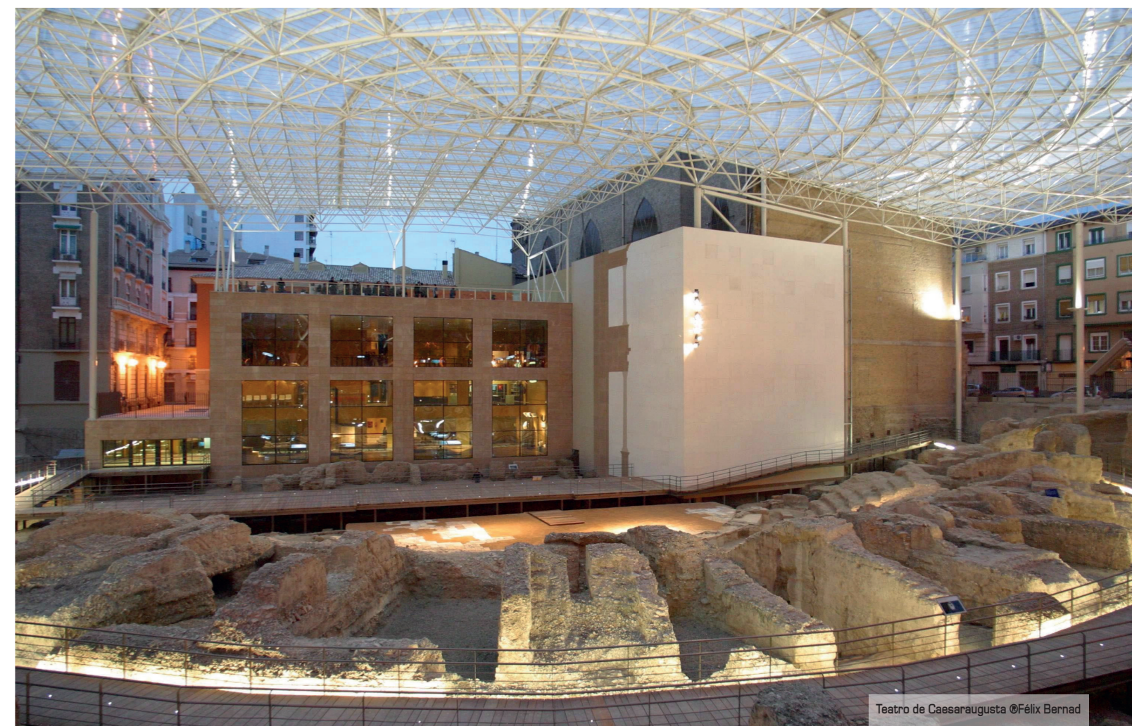
Teatro de Caesaraugusta

El hotel tiene una sala para eventos de hasta 90 personas en teatro, divisible en tres y decorada por artistas urbanos locales. En septiembre se estrena un nuevo espacio de co-working y otra sala panelable de la misma capacidad,