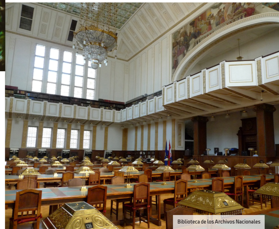
Biblioteca de los Archivos Nacionales

En el mes de marzo tiene lugar el Festival de las Luces: las iluminaciones recrean diferentes ambientes que abar-