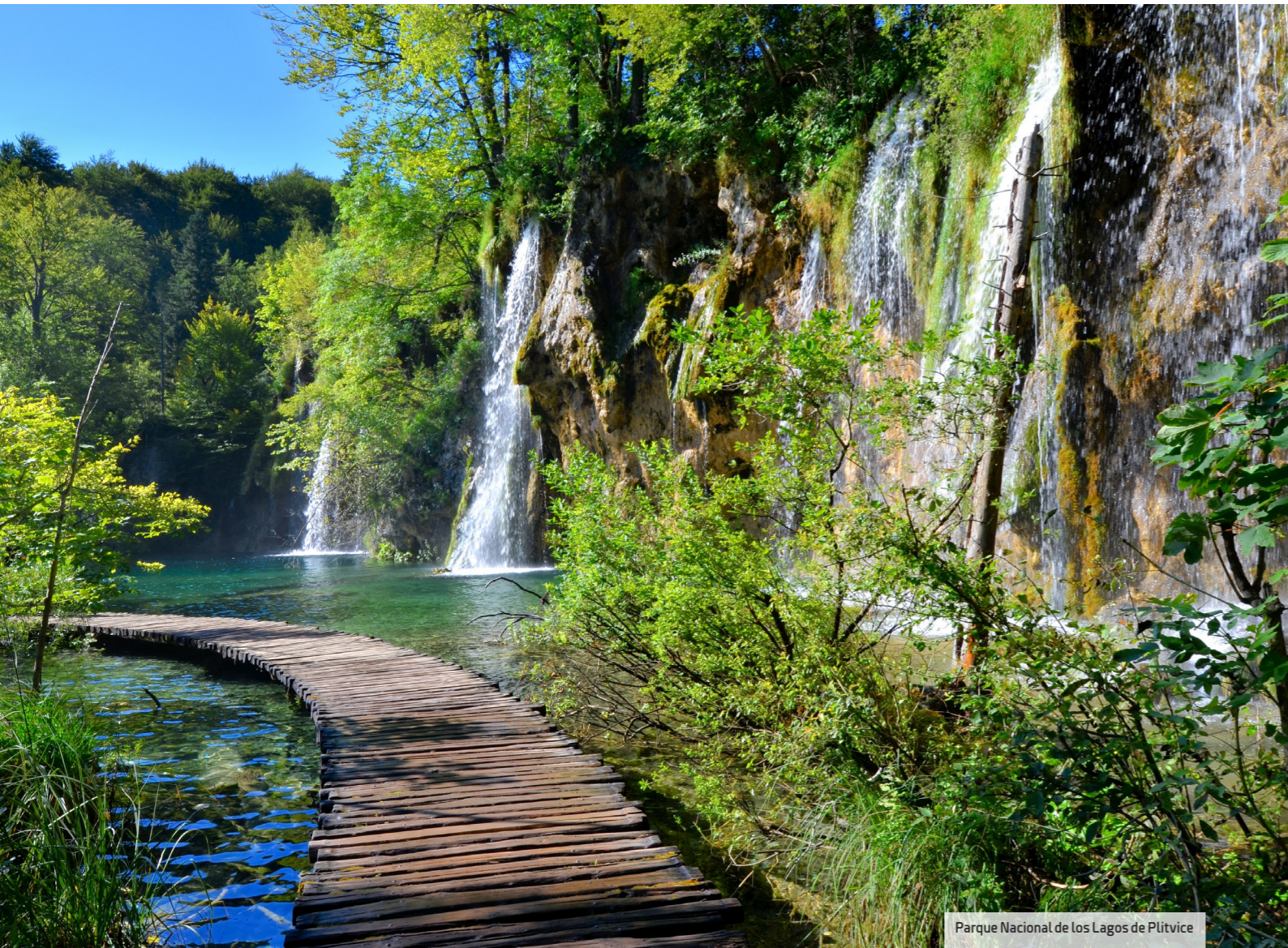
Parque Nacional de los Lagos de Plitvice

El Amphora Hotel , de 296 habitaciones, es además un museo de ánforas que se ofrece para convenciones alejadas de la ciudad y en las que terminar las jornadas profesionales en la playa o el spa . La sala destinada a conferencias puede recibir en condiciones normales a 300 delegados.