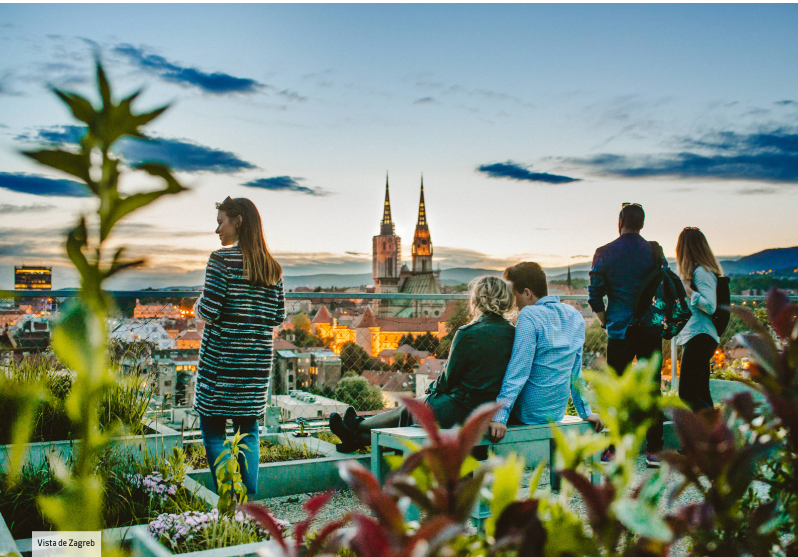
Vista de Zagreb

Con la inauguración en 2018 del Amadria Park Hotel Capital en el centro, Zagreb amplió su oferta para grupos. El hotel ocupa un edificio de principios del siglo XX completamente remodelado y con 112 habitaciones. Cuenta con la distinción Heritage por ser un inmueble emblemático. Para eventos se ofrece el Capital Business Salon, de 50 m 2 y el Capital Private Club, de 30 m 2 .