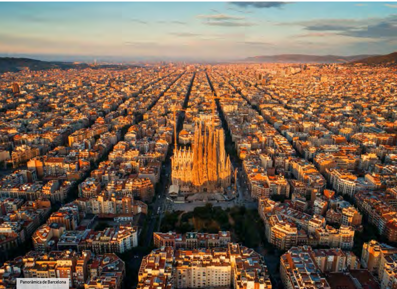
Panorámica de Barcelona

El último ranking de los destinos más populares para reuniones y eventos publicado por CWT Meetings & Events,