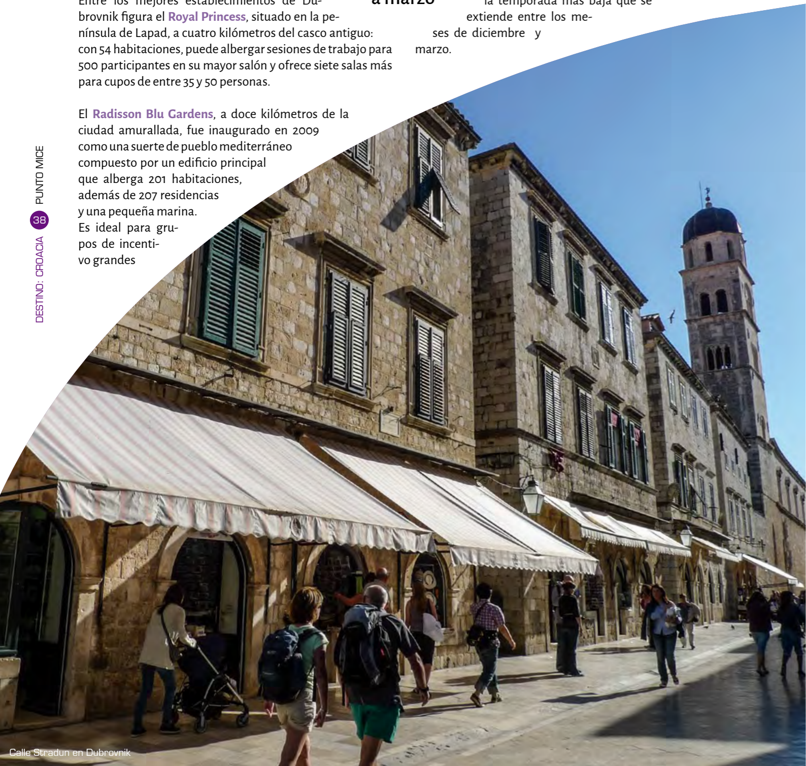
Calle Stradun en Dubrovnik