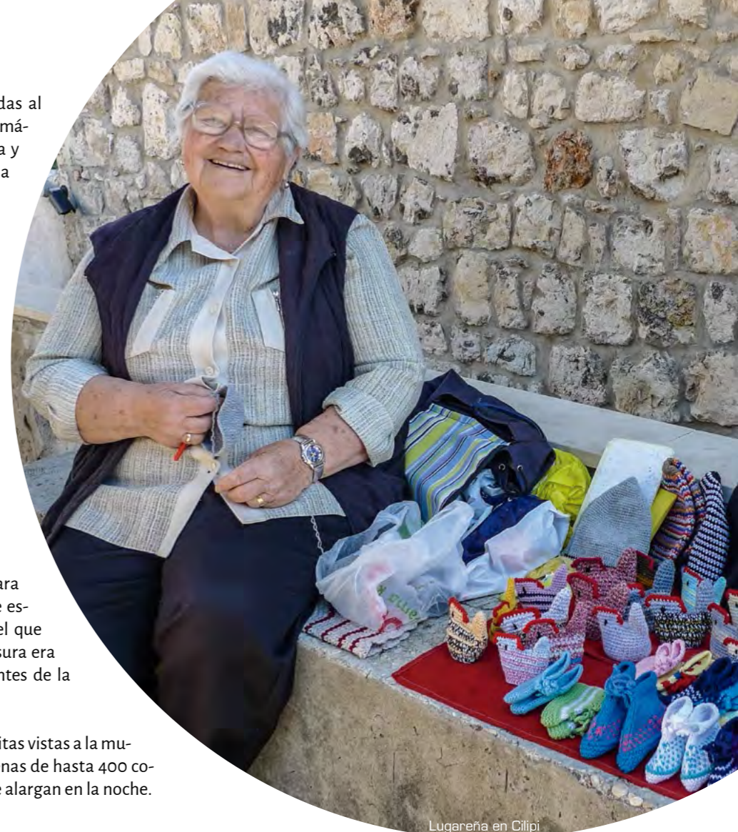
Lugareña en Cilipi

Algunos de los mejores viñedos croatas se encuentran en esta región llamada Konavle: los receptivos proponen su visita a lo largo de un recorrido en bicicleta, a caballo o en jeep ,