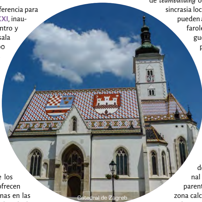
Catedral de Zagreb

Los hoteles más utilizados para eventos profesionales se encuentran en las inmediaciones de la ciudad amurallada, a la que es fácil acceder fuera de la temporada de cruceros que se prolonga de abril a septiembre.