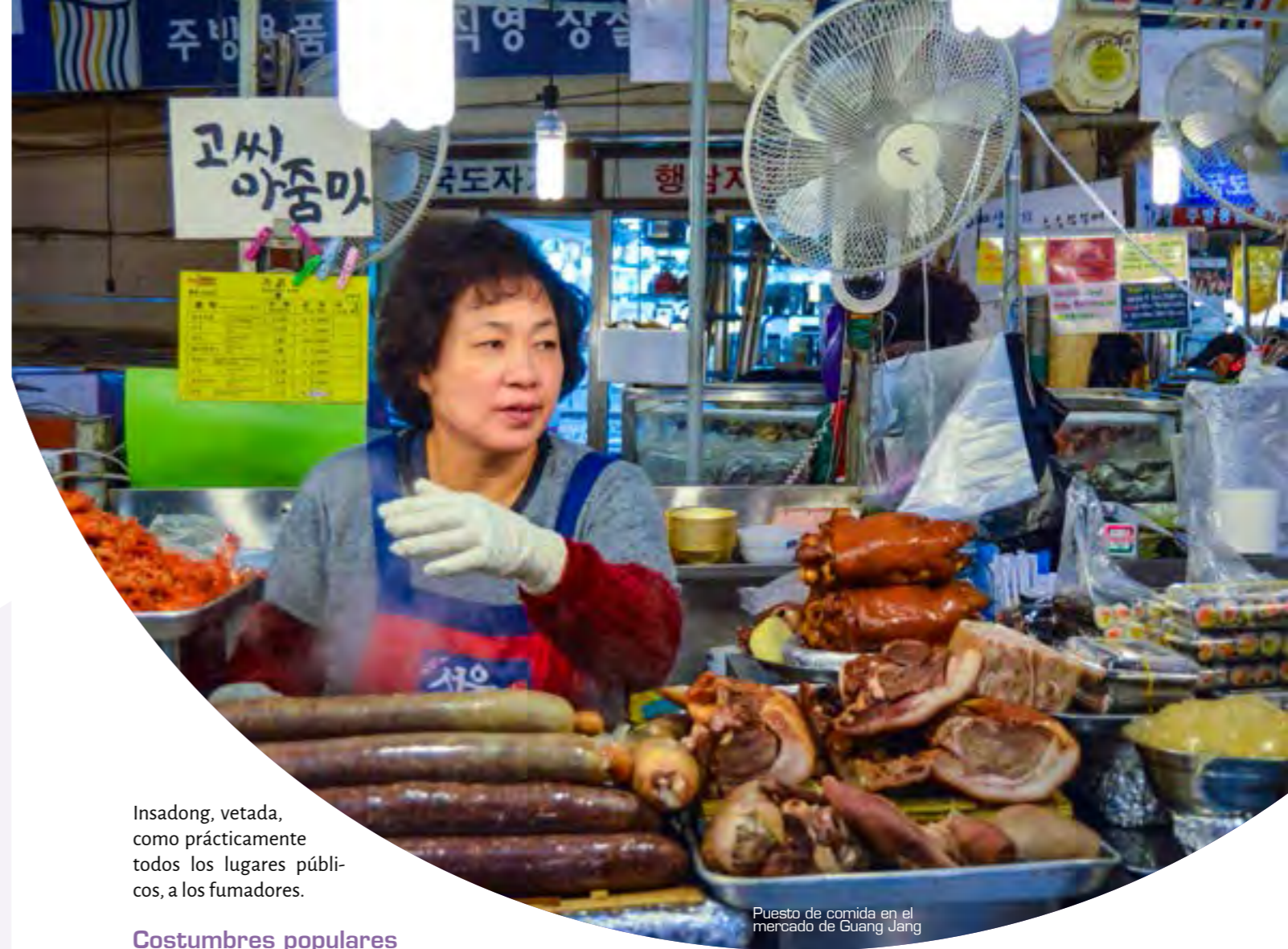
Puesto de comida en el mercado de Guang Jang

La otra cara de la moneda se aprecia perfectamente en espacios populares como el mercado Guang Jang, donde parece imposible instalar más puestos de comida, o la calle Insadong, com-