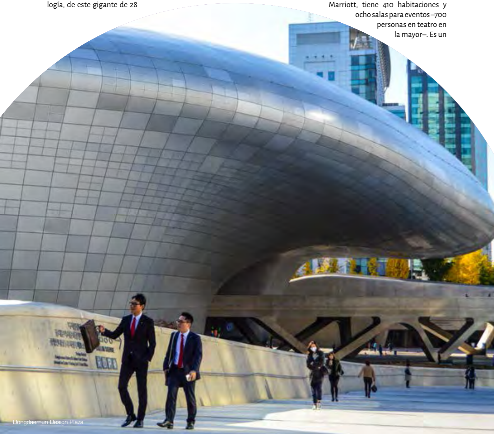
Dongdaemun Design Plaza

provocados por la ocupación japonesa, hoy propone un interesante recorrido por las tradiciones palaciegas en torno a proezas arquitectónicas como las sorprendentes chimeneas. No está permitido organizar eventos en su interior.