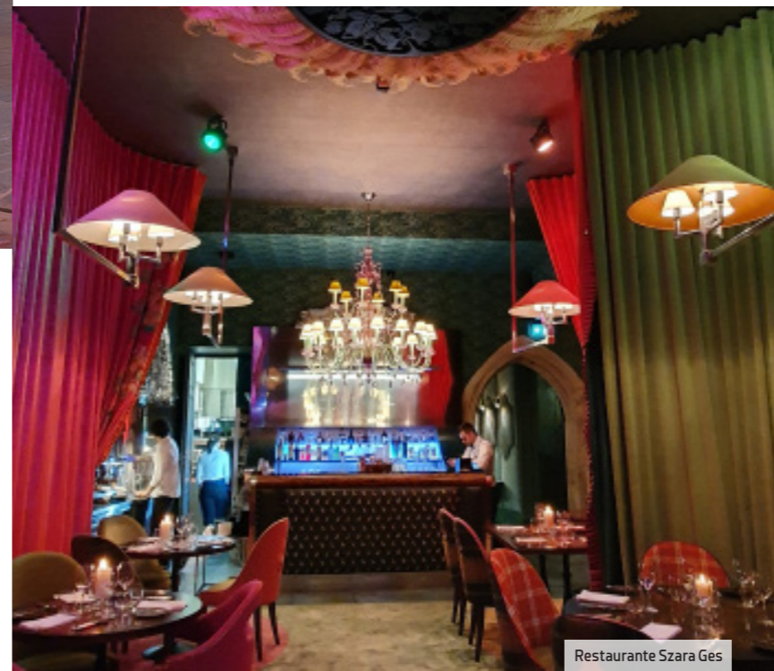
Restaurante Szara Ges

Hoy se compone de varias sedes entre las que se incluye esta sala dedicada a la pintura polaca. En total son cuatro salas dedicadas a cuatro épocas que albergan eventos corporativos con limitaciones en cuanto a catering .