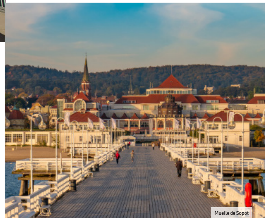
Muelle de Sopot

En el más grande de los tres apartamentos que completan la oferta de habitaciones, ocho personas pueden disfrutar de las vistas a la ciudad antigua. La terraza de la parte superior del edificio se ofrece para fiestas de hasta 160 invitados. Cuenta además con sala fitness , spa con cinco cabinas de masaje y piscina interior.