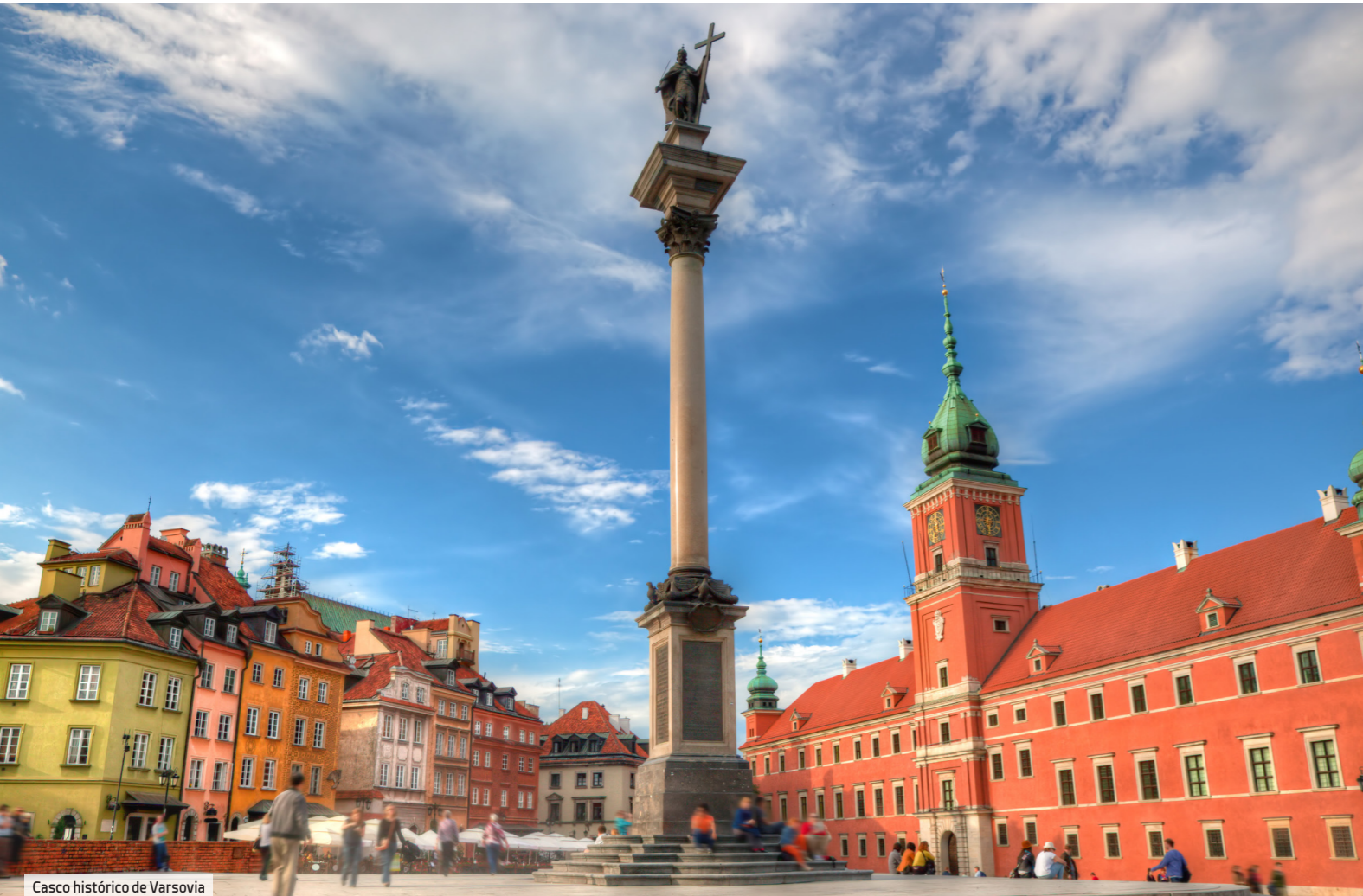
Casco histórico de Varsovia

A orillas del río Vístula, la cuna de Chopin tardó en figurar en los mapas turísticos. Sin embargo, no le faltan