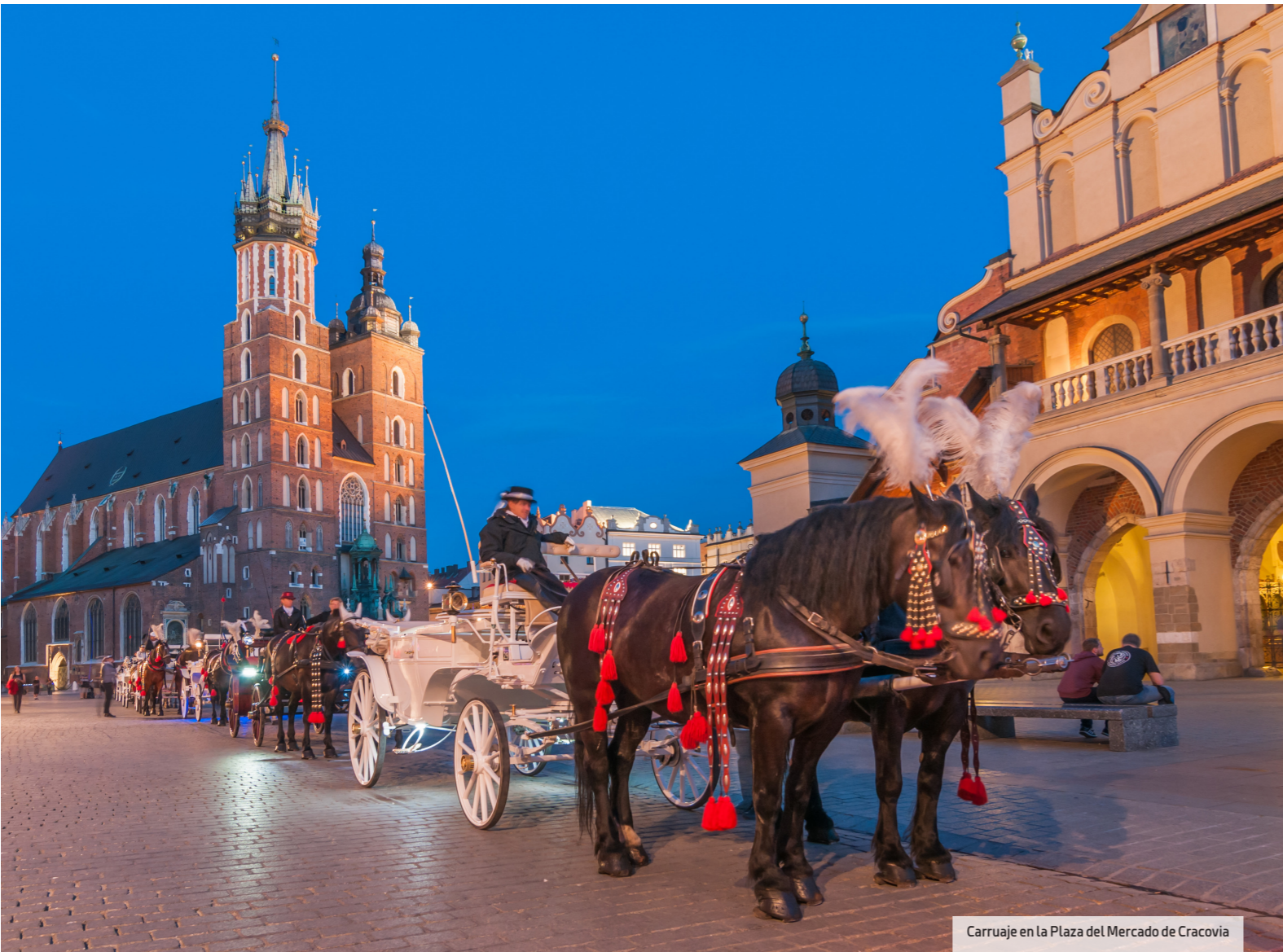
Carruaje en La Plaza del Mercado de Cracovia

Fue al otro lado del río cuando se creó en 1941 el gueto que concentró 17.000 habitantes, en su mayoría trasladados desde la actual Plaza de los Héroes hasta los campos de concentración y exterminio que se construyeron en los alrededores. La visita del escalofriante complejo Auschwitz-Birkenau, a 70 kilómetros de la ciudad, ocupa media