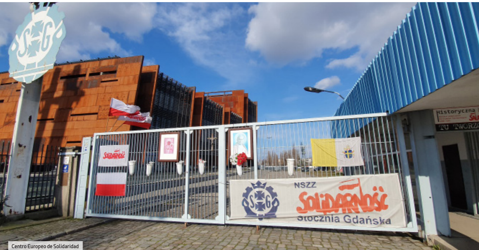
Centro Europeo de Solidaridad

Gdynia es una ciudad nueva, el mejor ejemplo de arquitectura modernista polaca, con un original e interesante espacio para eventos: