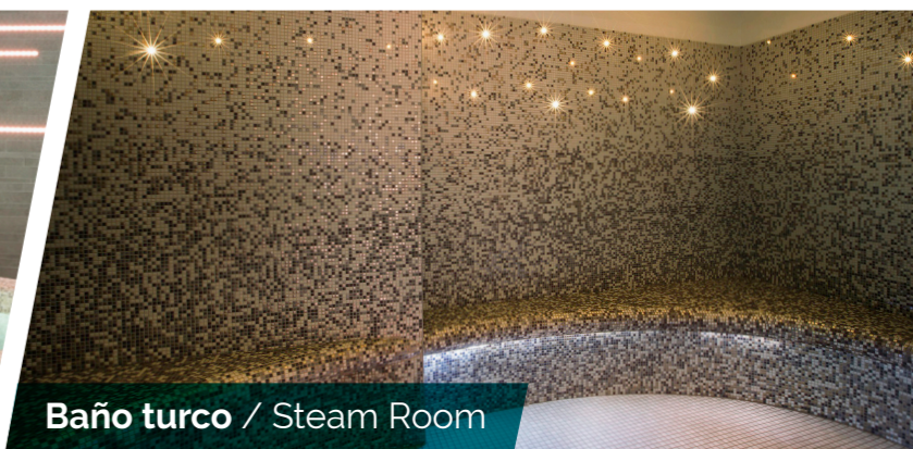
Baño turco / Steam Room