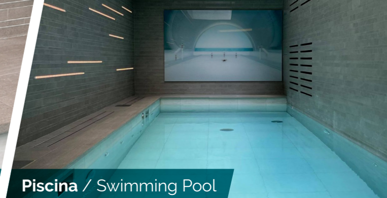
Piscina / Swimming Pool