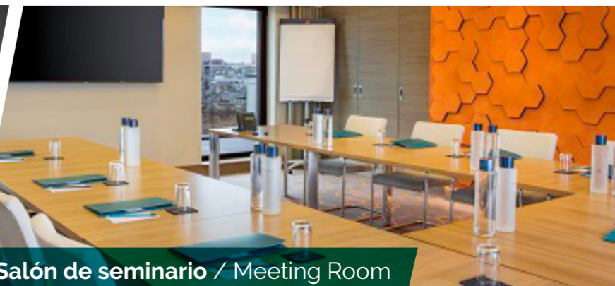
Salón de seminario / Meeting Room

27, avenue Jean Janvier • 35000 Rennes +33 (0)2 23 44 33 33 • contact@saint-antoine-hotel.fr