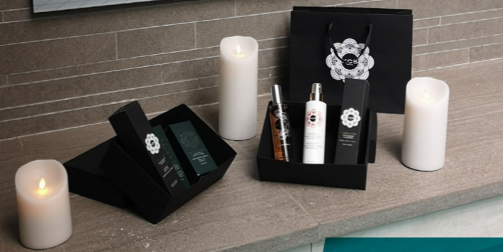
Spa KOS PARIS

A 4-STAR HOTEL LOCATED IN THE HEART OF THE CITY CENTRE OF RENNES, THE BW PREMIER COLLECTION SAINT-ANTOINE COMBINES COMFORT, AESTHETICISM AND MODERNITY