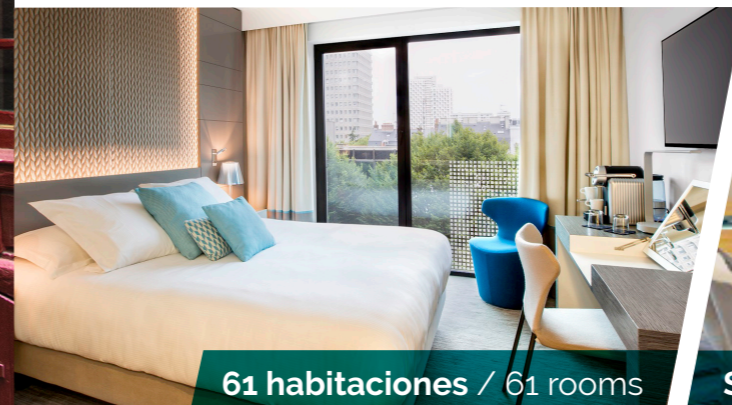
61 habitaciones / 61 rooms