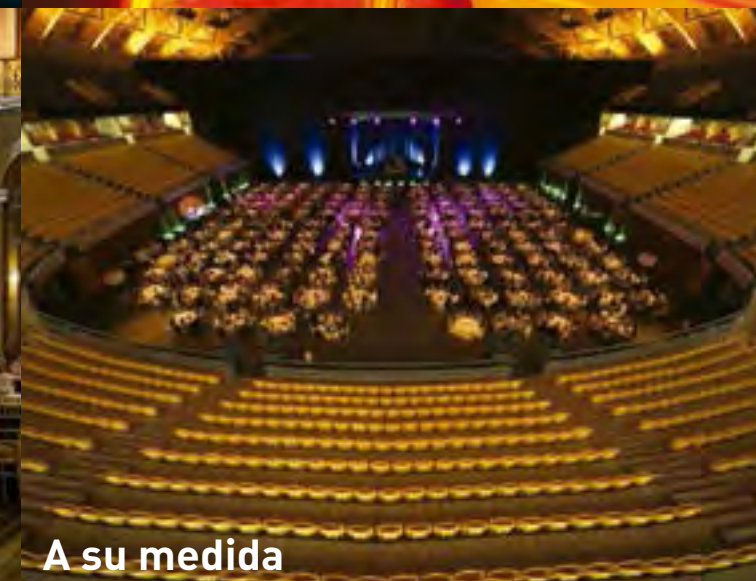
A su medida