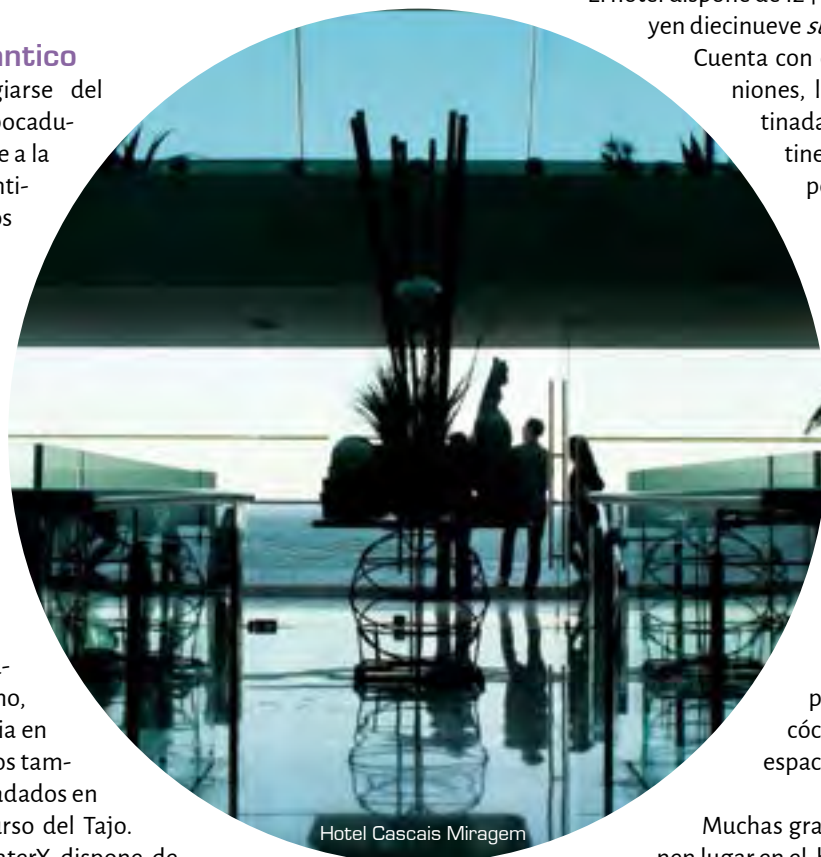
Hotel Cascais Miragem

Lisboa gana puestos entre los destinos de convenciones y programas lúdicos para empresas porque se trata de una ciudad pequeña, en la que todo parece estar a mano; las diferentes propuestas en cuanto a espacios están bien comunicadas y la buena disposición de los portugueses hace que