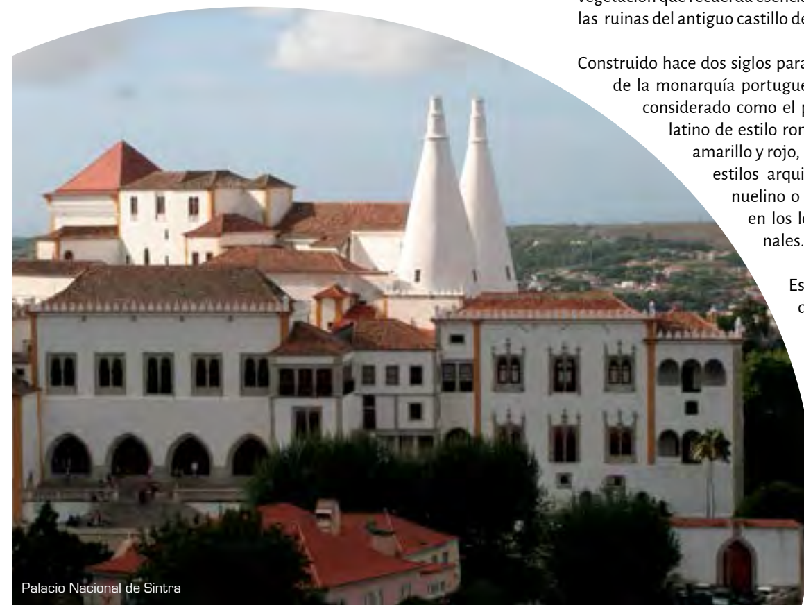
Palacio Nacional de Sintra

Este palacio real también puede ser utilizado para eventos corporativos. Cualquier formato estará impregnado de la atmósfera victoriana, herencia de las relaciones entre Portugal y el Reino Unido. El salón noble puede acoger cócteles de hasta 80 in-