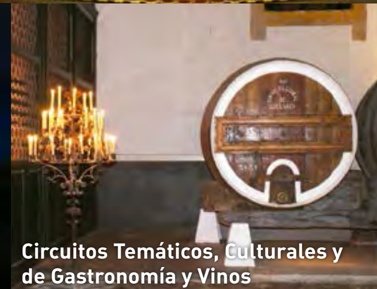
Circuitos Temáticos, Culturales y de Gastronomía y Vinos