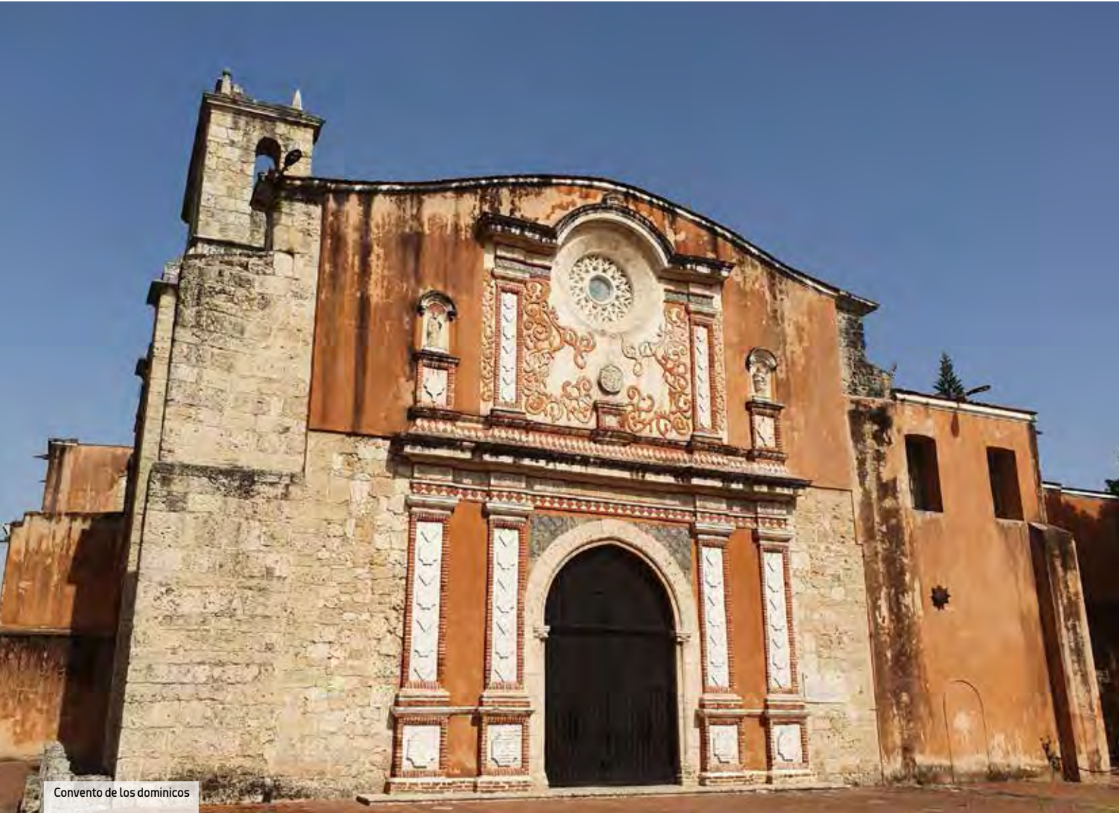
Convento de los dominicos

Otros hoteles de la ciudad han sido renovados en los últimos años. Es el caso del Renaissance Santo Domingo Jaragua Hotel & Casino , el mayor para convenciones en Santo Domingo y conectado con el casino más exclusivo del destino. En total ofrece 300 habitaciones en dos edificios y 13 espacios para eventos, el mayor capaz de recibir