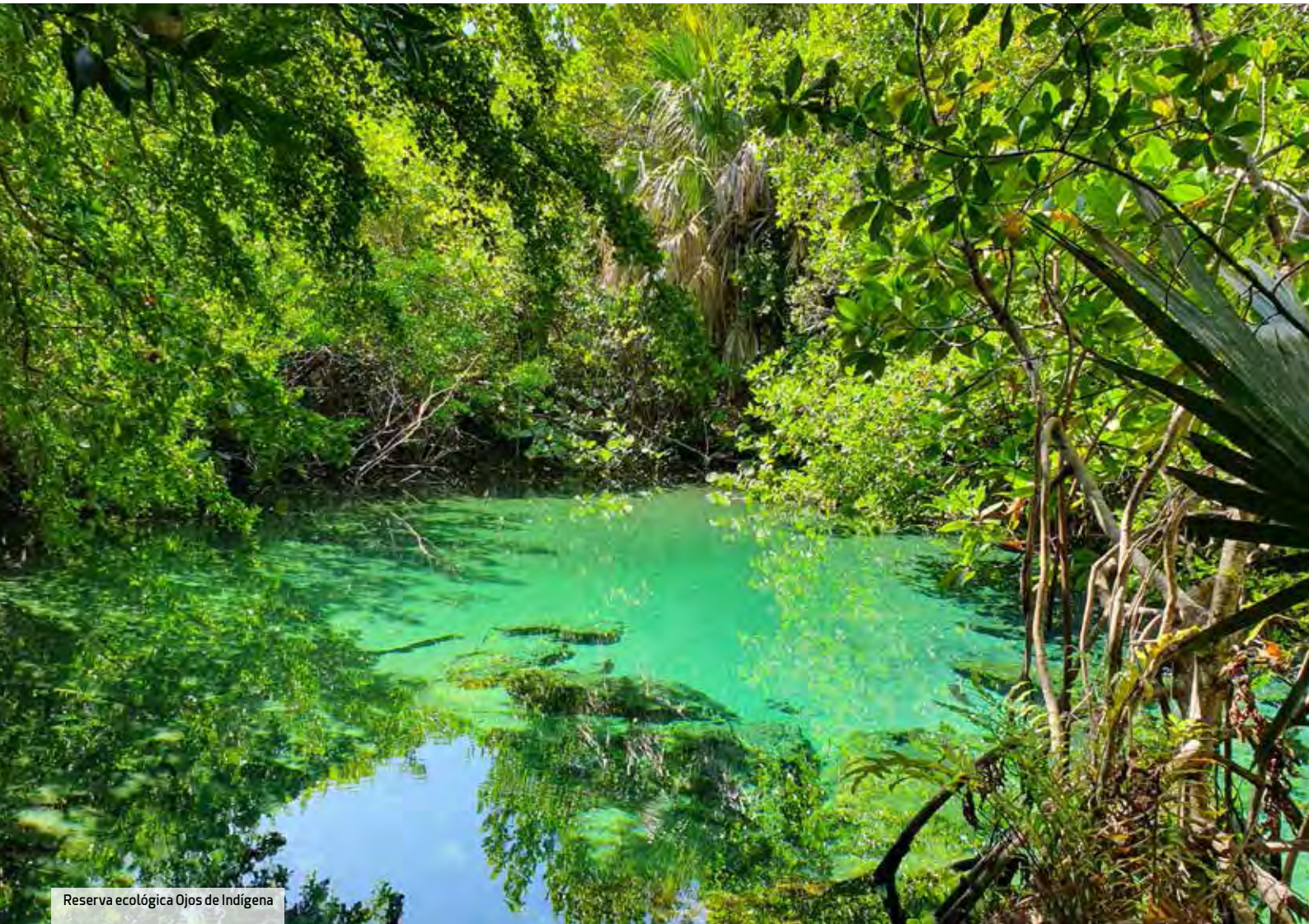
Reserva ecológica Ojos de Indígena

Puntacana Resort & Club es un oasis de exclusividad dentro de Punta Cana. Como parte de las iniciativas que demuestran el compromiso con el medioambiente por parte del grupo Puntacana, la Reserva Ecológica Ojos Indígenas reproduce la flora local en un espacio paradisíaco