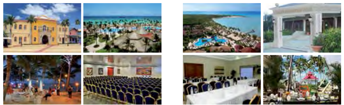
PUNTA CANA, BÁVARO República Dominicana