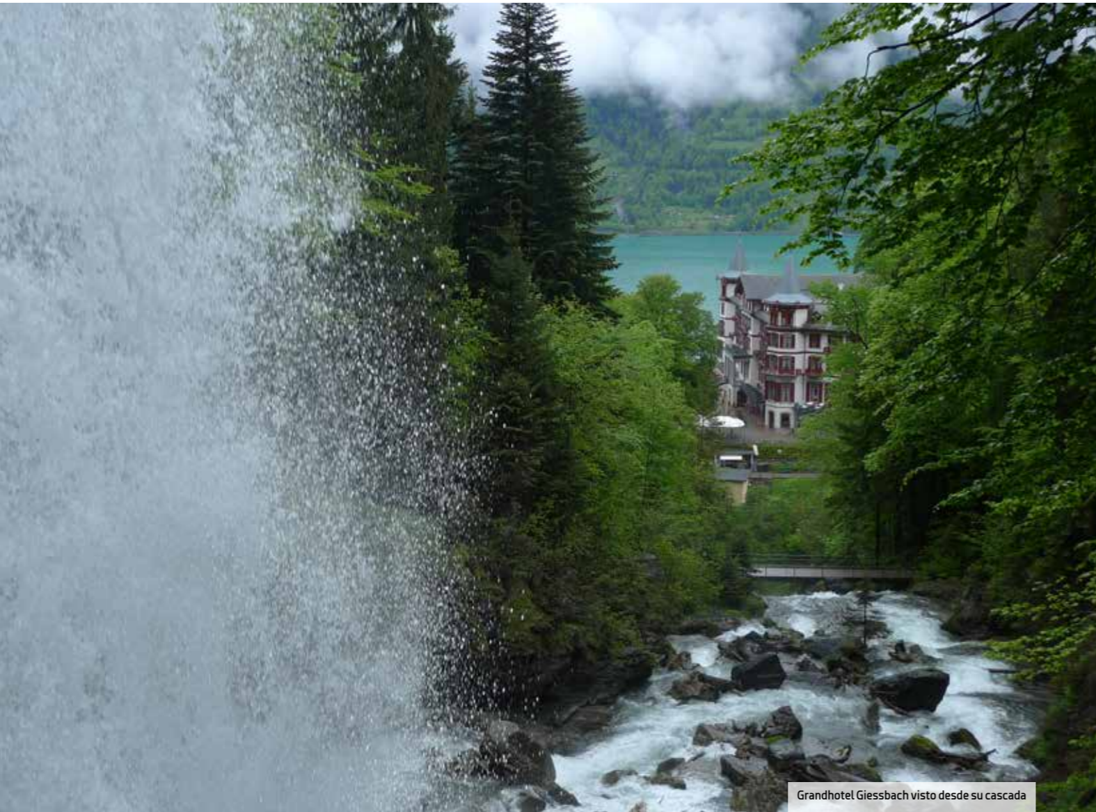
Grandhotel Giessbach visto desde su cascada

Suiza es un destino que se puede disfrutar todo el año, si bien es recomendable evitar la época de deshielo si se organizan actividades en los bosques, ya que son menos vistosos y los servicios de mantenimiento están conti-