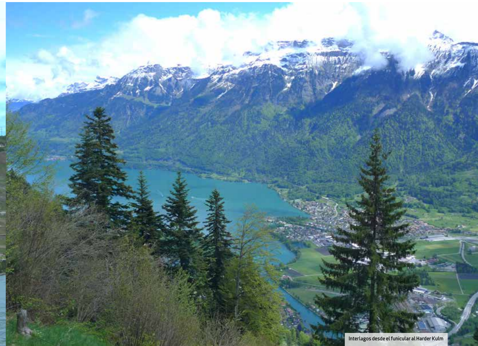
Interlagos desde el funicular al Harder Kulm

Todos los lagos suizos se prestan a actividades como paddle board , regatas de vela o teambuildings basados en la construcción de balsas para navegar. Sin embargo, el mayor incentivo asociado a los lagos es el paseo en tren pa-