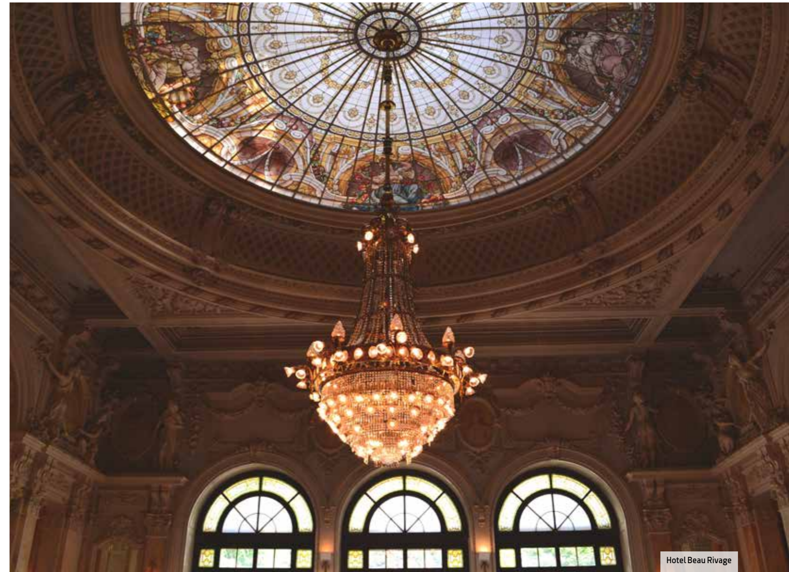
Hotel Beau Rivage

Beau Rivage Palace , construido a finales del siglo XIX, no ha perdido un ápice de su atmósfera romántica. La decoración lo recuerda en cada una de las 168 habitaciones y salas para eventos, entre las que destacan Rotonda, para un máximo de 200 comensales, y Sandoz, con 430 m 2 bajo una espectacular bóveda acristalada. El spa Cinq mondes también figura entre los atractivos de este emblemático cinco estrellas donde se respira exclusividad por doquier.