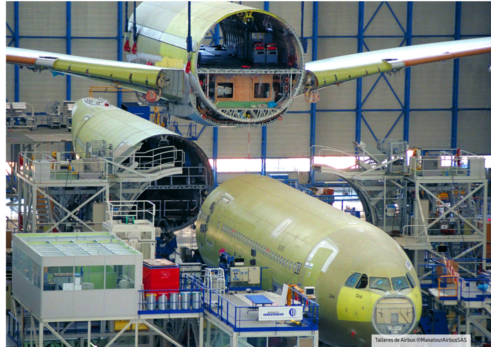
Talleres de Airbus

En 1918, un grupo de intrépidos aviadores, entre los que se encontraba Antoine de Saint-Exupéry, mundialmente co-