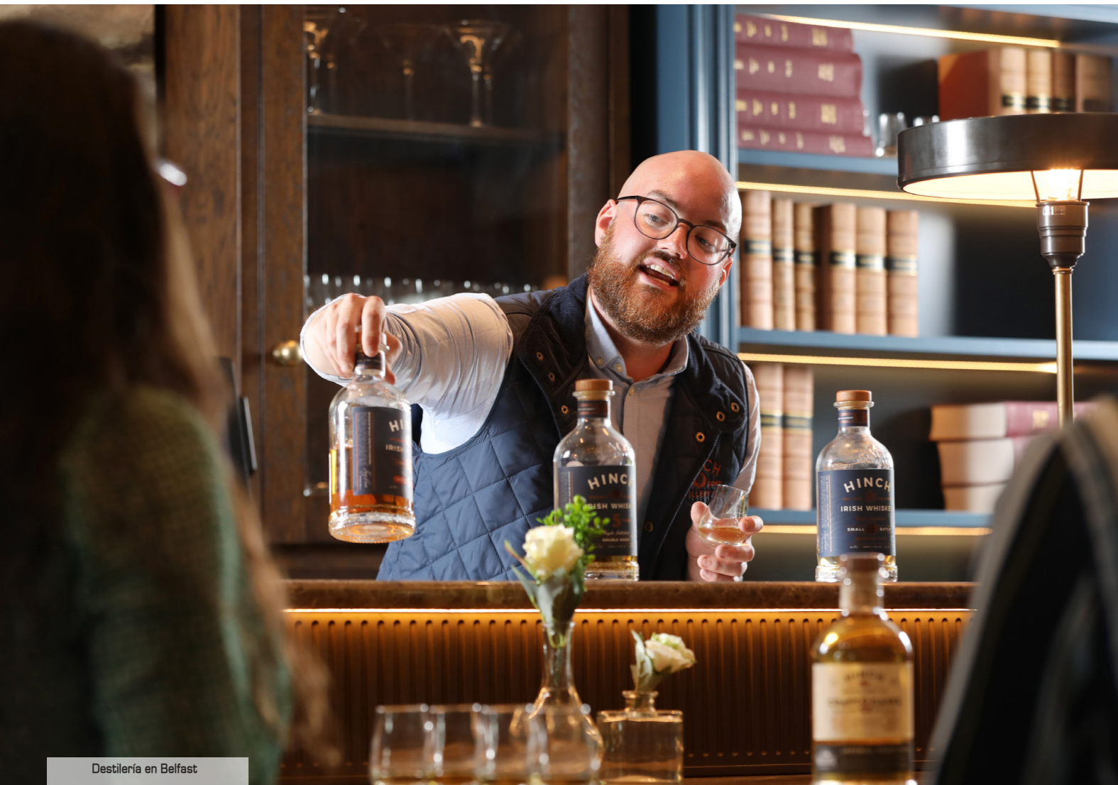
Destilería en Belfast

El Merchant Hotel , de cinco estrellas, ocupa la antigua sede del Ulster Bank, un bello edificio de arenisca de 1860. Su grandioso vestíbulo, donde se encuentra su galardonado restaurante, se ilumina con el mayor candelabro de cristal de Irlanda. El restaurante cuenta con pequeñas salas para comidas privadas, incluyendo la que albergó la caja fuerte,